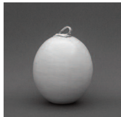
3048 "Ovo", barro branco polido e vidrado, porcelana e ouro; 21x16cm, 2013