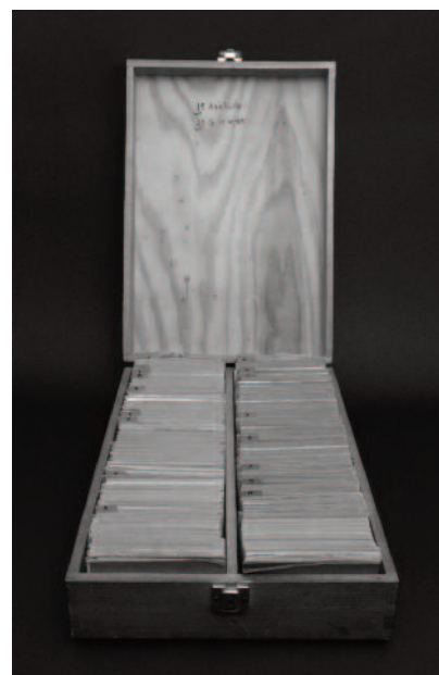
Caixa-ficheiro com todos os nomes dos locatários dos cofres de aluguer

O resultado é a exposição 3553. Para tal, abriram-se 120 cofres para se apresentar tantas outras peças, na sua quase totalidade pensadas e produzidas especialmente para o efeito. À medida que olhamos para as diferentes peças, reconhecemos-lhes afinidades formais e materiais que nos permitem reconstituir famílias de naturezas distintas. Em exposição encontramos taças e outros recipientes, caixas, pratos e almofadas. Peças que parecem destinar-se a uma utilidade prática, comum e diária, mas que vivem num território difícil de definir, dada a sua fragilidade, graciosidade e delicadeza. Estas características comprometem esse provável uso, remetendo-as para um outro universo, mais decorativo ou cerimonial. A extrema simplicidade formal e o uso do barro branco, polido ou vidrado, imprimem uma qualidade intemporal a cada peça. Ao mesmo tempo que evocam formas ancestrais que imaginamos podiam conter, servir ou armazenar água, cereais ou óleos sagrados, reivindicam o estatuto de objetos de culto ou de peças de coleção.