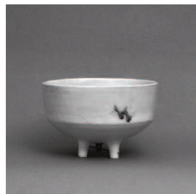
1816 "Taça com guizo de ferro II", barro branco polido e vidrado, óxido de cobre, ferro, prata oxidada; 15x22cm, 2013