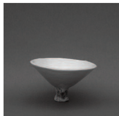
2243 "Tacinha com pé em osso", barro branco polido e vidrado, osso; 8x14cm, 2012