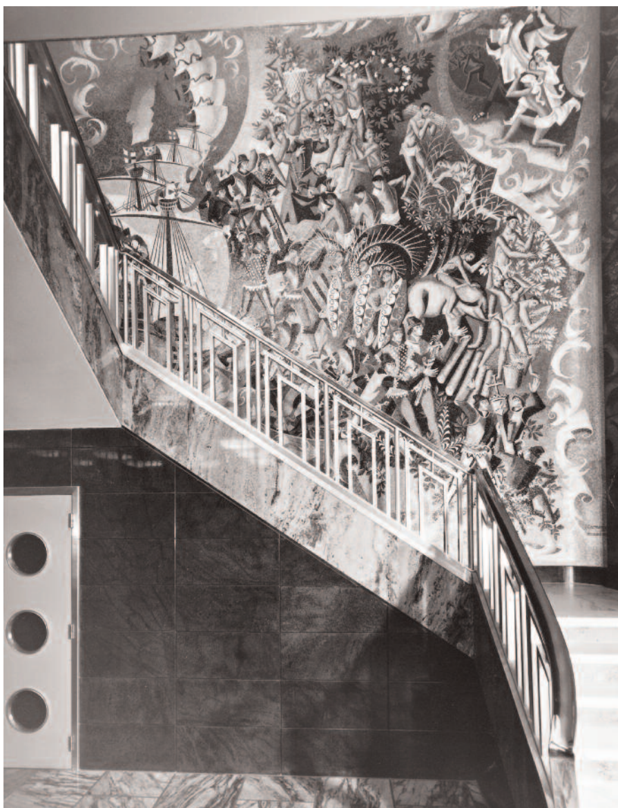
Acesso aos cofres de aluguer, Mural de Guilherme Camarinha, Prova fotográfica assinada Horácio Novais c. 1964 Arquivo Histórico CGD